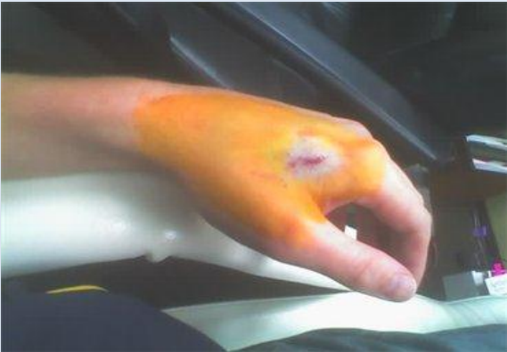
ሃዋርያው የሃንስ በራዕዩ ላይ አመልክቶናል።

ይህ RFID (Radio Frequency Identification) በመባል የሚታወቀው (micro-chips) በሰው ቀኝ እጅ ላይ የሚቀበረው መሳሪያ የስንዴ ቅንጣት ይዘቱ የሚያኸል ነው። በዚህም አሜሪካ የአውሬውን ምስል በመስራት መንገድ በመጥረግ ላይ ትገኛለች። ያለማንበቢያ መሳሪያው በሰው እጅ ውስጥ የተቀበረው ይህ (micro-chips) የት እንዳለ አይታወቅም። እስከቅርብ ጊዜ ድረስ በቤት እንሰሰች ጆሮ ላይ እየተመታ የነበረው (micro-chips) አሁን በሰዎች እጅ ላይ መደረጉ ገሃድ እየሆነ መጥቷል። ይህንንም